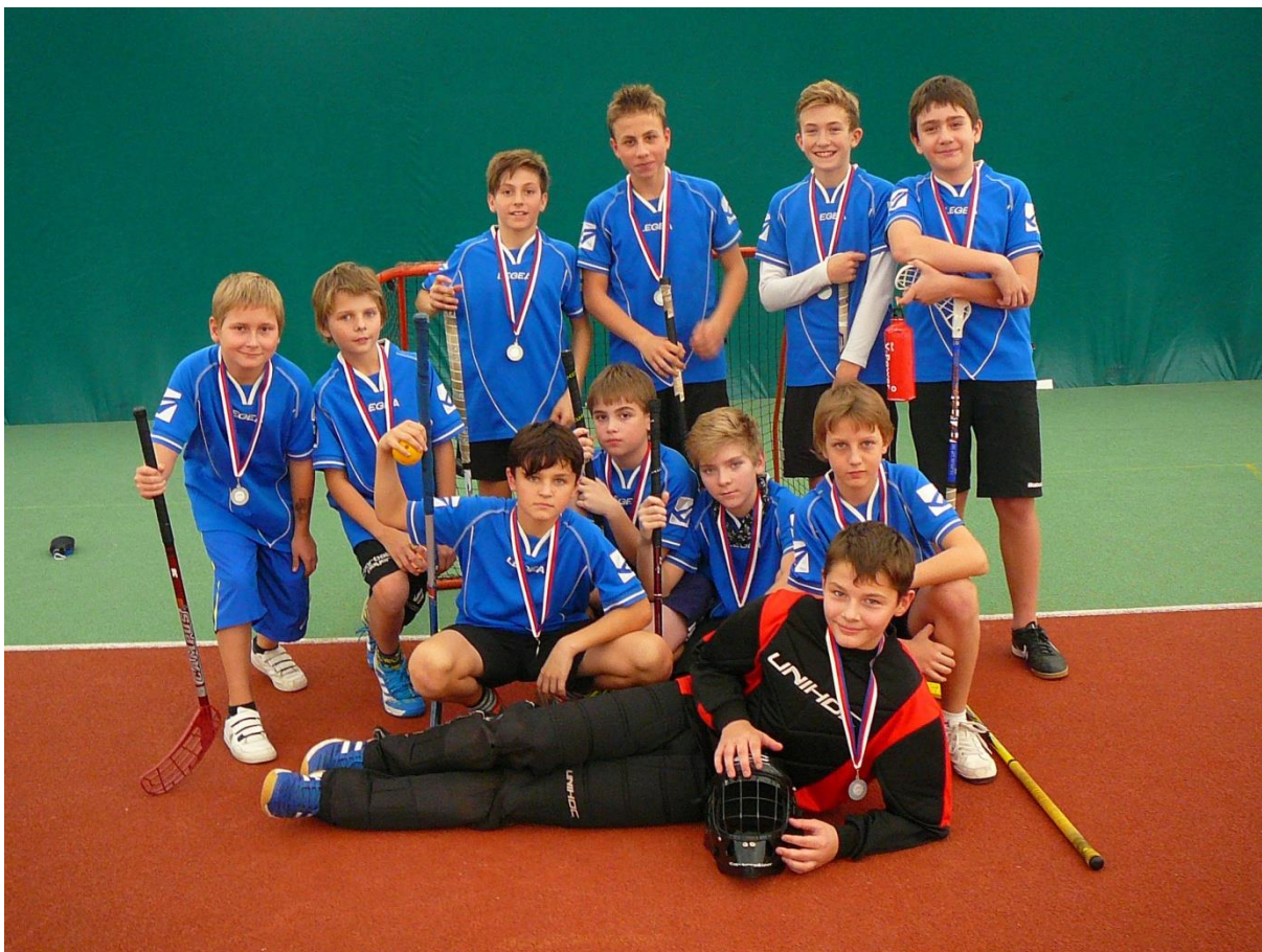
Družstvo žáků 6. a 7. tříd