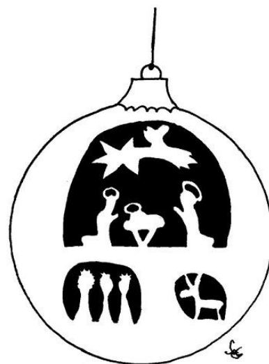
Obrázek: Apolena Soukupová, 9. A