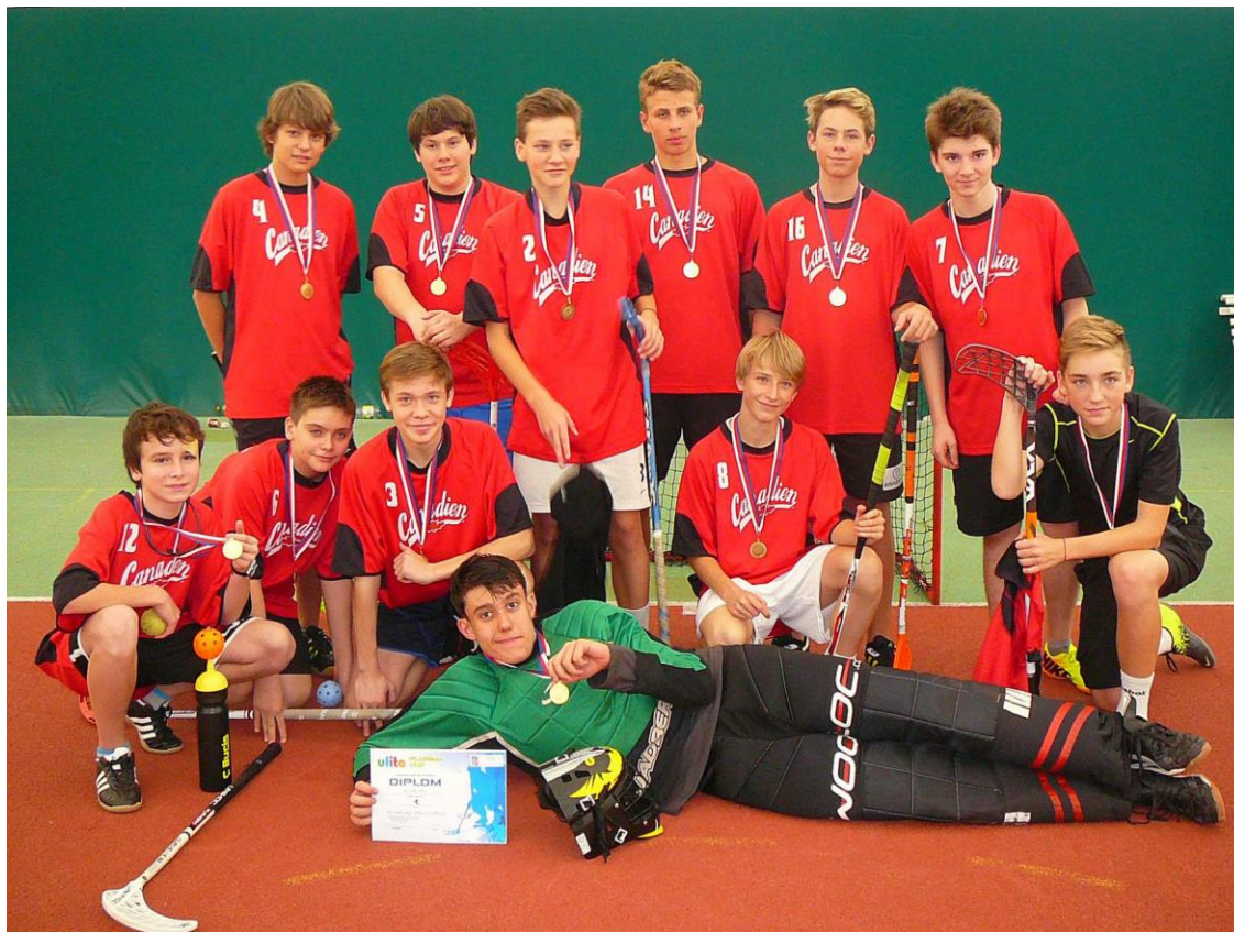
Družstvo žáků 8. a 9. Tříd

Nejdřív hráli starší chlapci. Hrání se u nás ve škole na domácích hřištích. Ve skupině skončili kluci na druhém místě a šli do druhé haly hrát o postup do finále s vítězem 2. skupiny. Tento důležitý zápas chlapci zvládli a už je čekal jen boj o 1. místo. Zahráli jsme si odvetu s družstvem, které nás porazilo ve skupině a porážku jsme jim vrátili. Byli jsme tedy první a postoupili jsme do krajského semifinále.