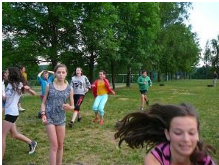
Škola v přírodě 6. – 9. ročník, Zvíkov.

Na školy v přírodě vyjeli žáci obou stupňů, pedagogové se snaží hledat zajímavá místa, nabídnout atraktivní program a zajistit potřebný komfort ubytování za přijatelnou cenu. Přesto je pro rodiny některých žáků úhrada nákladů na školu v přírodě vzhledem k jejich finanční situaci výrazným problémem. V řadě případů pomáhají sociální příspěvky, ale některé rodiny na příspěvek nedosáhnou a dítě se pak výjezdu nemůže zúčastnit. Pozitivní je, že někteří rodiče jsou ochotni přispět na úhradu nákladů za cizí dítě, které by se jinak školního výjezdu nemohlo účastnit. Pomoc nabízí i Klub rodičů.