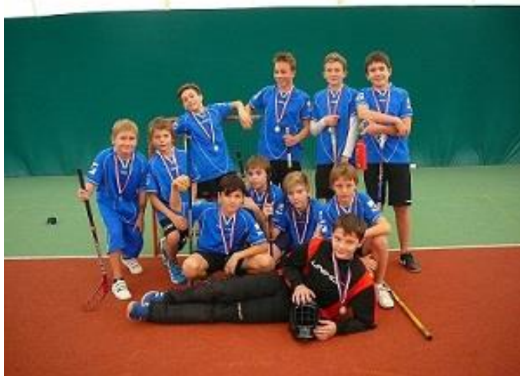
Družstvo chlapců 6. a 7. ročníku úspěšně reprezentovalo školu na turnaji Orion Cup.

Škola se také podílela na organizaci obvodních kol soutěží ve florbalu a vybíjené (spolu s DDM Ulita), v našem sportovním areálu se konalo také obvodní kolo fotbalové soutěže Mc Donald's Cup (ve spolupráci s Asociací školních sportovních klubů).