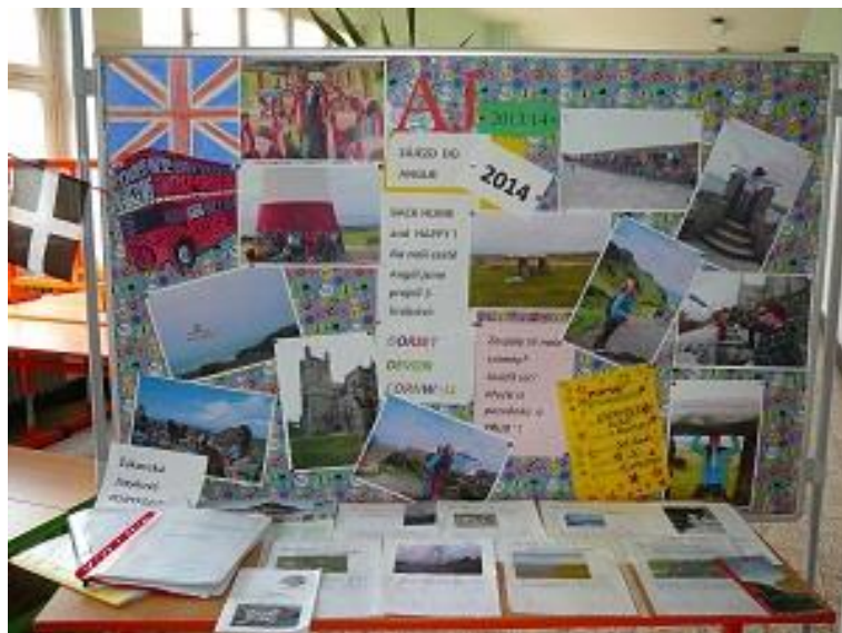
Společenský večer pro rodiče – prezentace žáků k zájezdu do Velké Británie.

Již v průběhu zájezdu se mohly děti zapojit do vědomostních a jazykových soutěží, které doplnila po návratu do školy ještě fotografická soutěž. Počátkem června se také konal společenský večer pro rodiče dětí, jež se účastnily zájezdu, i pro další zájemce. Děti si připravily prezentace o své cestě, zároveň byl rodičům představen program příštího zájezdu. O tuto akci je každým rokem mezi rodiči větší zájem, ti také oceňují to, že díky doprovodným akcím škola připravuje dětem nejen cestu za poznáním, ale rozvíjí i jejich další potřebné kompetence.