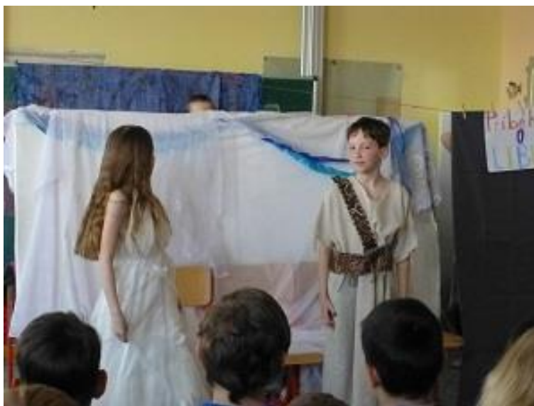
Projektový den Česko – dramatizace národních pověstí (třída 4. B).

V tomto školním roce jsme se ve škole věnovali především projektu Comenius a dílčím projektům, které z něj vyplývaly, proto jsme se rozhodli omezit jiné rozsáhlejší projekty. Žáci obou stupňů na pracovišti Lobkovicovo pracovali na větším projektu Česko , zapojili se do něj ve výuce většiny předmětů a zaměřili se na poznávání České republiky, její historie, geografie, literatury apod. Výsledky své práce pak prezentovali ostatním žákům školy během projektového dne.