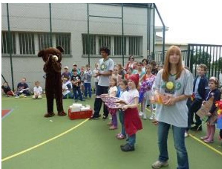
Projekt Comenius – dílčí projekt Mistrovství světa ve fotbale (na snímku rovněž zahraniční asistent z Portugalska).