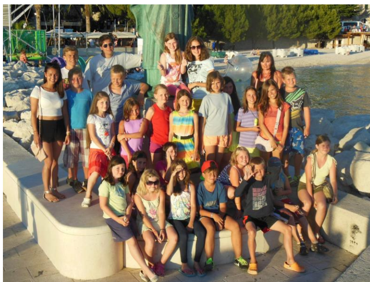
Letní tábor školní družiny v Chorvatsku.

Učitelé motivují žáky k účasti v předmětových, sportovních i dalších vědomostních či uměleckých soutěžích. Cílem školy je pomoci žákům objevit jejich nadání a dále toto nadání rozvíjet. Nezanedbatelným přínosem pro žáky je rovněž získávání vědomostí a dovedností nad rámec výuky, získávají také hodnotnou náplň volného času a v neposlední řadě jim účast v soutěžích může pomoci i v jejich profesní orientaci.