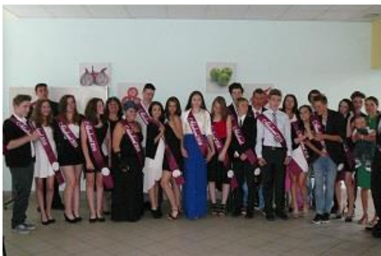
Slavnostní rozloučení se žáky 9. ročníku škola organizuje s finanční podporou Klubu rodičů.

Třídní učitelé i další pedagogové usilují zároveň o co nejužší individuální spolupráci s rodiči žáků . Škola je rodičům otevřená, rodiče se mohou sejit s učiteli, vychovatelkami i vedením školy, kdykoli o to projeví zájem. Škola se snaží o co nejlepší komunikaci s rodiči, cílem je především včasné řešení všech výukových obtíží i dalších problémů dětí. Stále více v tomto směru využíváme i možnost elektronické komunikace s rodiči, která je velmi operativní, ovšem nemůže plně nahradit osobní jednání učitelů s rodiči. Při řešení problémů se nám také velmi osvědčily společné schůzky rodičů, pedagogů a dětí, zapojení všech tří stran lépe umožňuje dosáhnout uspokojivého řešení problému. Tento postup vítá i většina rodičů.