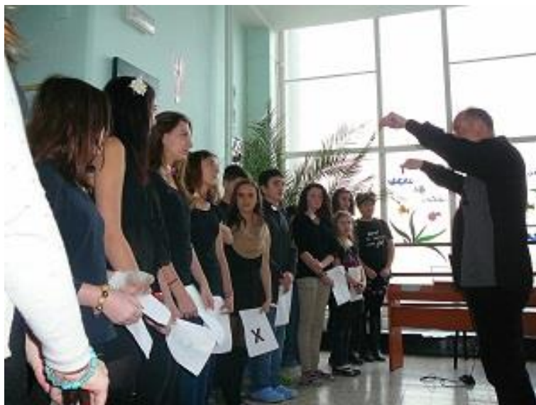
Vánoční zpívání na schodech – školní pěvecký sbor.

V tomto školním roce vznikl na naší škole nový dětský pěvecký sbor pod vedením MgA. Zdeňka Klumpara, který na škole vyučuje hudební výchovu a má dlouholeté zkušenosti s vedením dětských pěveckých sborů. Hlavním smyslem sboru je naplnit vhodně volný čas těch žáků školy, které mají pěvecké předpoklady a rády zpívají. Zpěv a hudba přináší dětem řadu krásných a smysluplných dojmů, které přispějí k jejich osobnímu rozvoji a kultuře. Během roku se počet členů sboru ustálil na 16 dětech. Repertoár tvoří jak lidové písně v jednohlasých až tříhlasých úpravách, tak písně z oblasti folku, country apod. Sbor připravil také vánoční program, děti si tak vyzkoušely i první veřejné vystoupení.